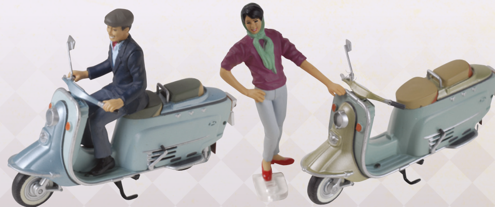
3. 富士重工業 Rabbit Super flow S601C 1964年（紳士版）

「風俗流行」：披頭四第一次訪日。搖滾樂團全盛時期來臨。流行蘑菇髮型及長髮。「超人力霸王」引發怪獸風潮。「週刊少年」雜誌（1967年1月8日號）突破100萬本，讀者群擴大到學生及青年層。