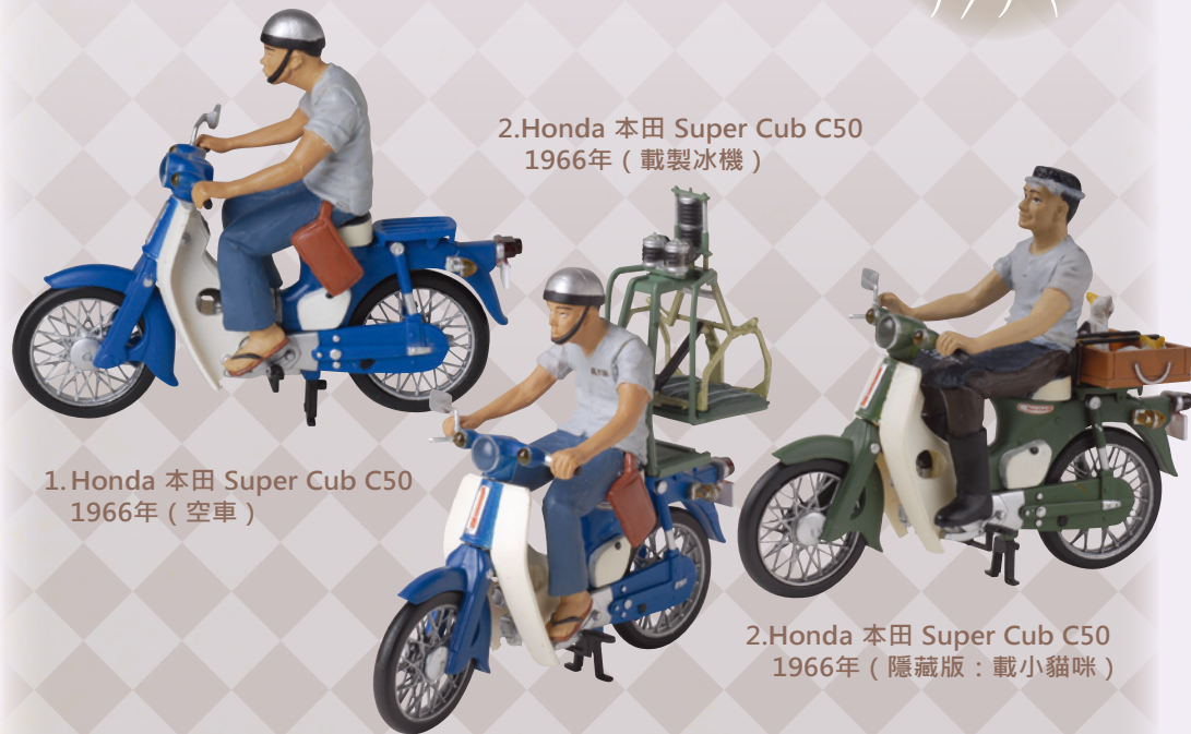
1. Honda 本田 Super Cub C50 1966年（空車）