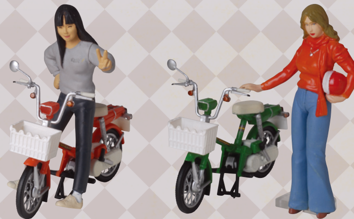
5. Honda 本田 Road Pal NC50 1976年（淑女版）

這是戰後富士重工業機車全盛時期的代表，時速最高可達100公里，被譽為日本的「機車之王」、「永恆的王者」，在1957年到1968年君臨了機車市場。「世相事件」：越戰期間。東京奧運。「風俗流行」：「平凡」週刊創刊，成為青年文化的發信中心。