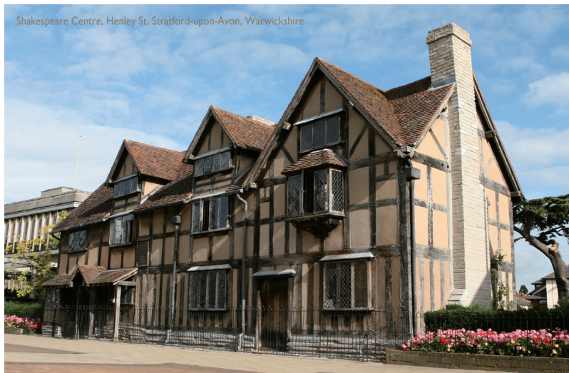
Shakespeare Centre, Henley St. Stratford-upon-Avon, Warwickshire