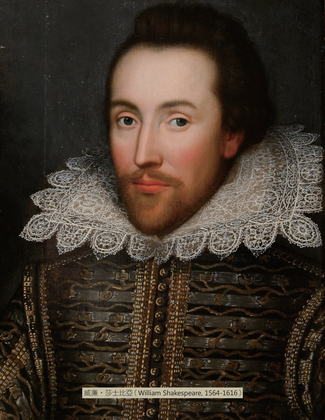
威廉·莎士比亞 (William Shakespeare, 1564-1616)