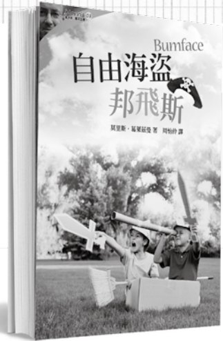
莫里斯·葛萊茲曼／著 周怡伶／譯