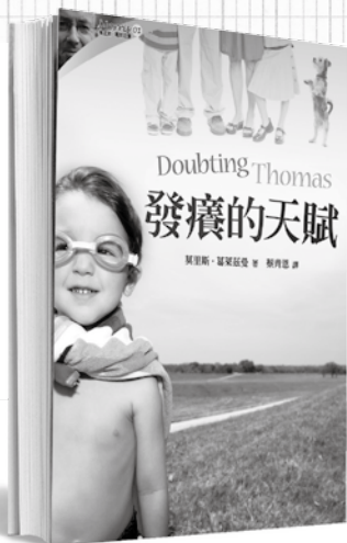
莫里斯·葛萊茲曼／著 蔡青恩／譯

在解決過程中，湯瑪斯還發覺到親人與朋友們隱藏在內心的種種問題，也讓身邊所有人體悟到友情與親情的真誠可貴。