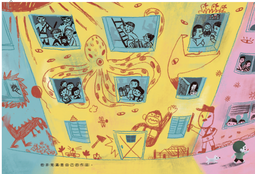
他非常滿意自己的作品。

「牆壁」固然可以保護我們，將我們不想要的東西阻隔在外，但另一方面也可用來把人們關在一個空間裡，限制大家的行動；或者因為一堵牆的阻隔，導致兩邊的人無法自由往來與交流……。不妨一起討論一下，下面兩個畫面呈現了什麼？出現在牆面上的那些「龐然大物」，大家曾在什麼地方（例如電影）見過嗎？窗戶裡每個房間正發生著什麼樣的故事呢？綿延的牆，加上軍人、軍犬、鐵絲拒馬等，給你什麼樣的感受？