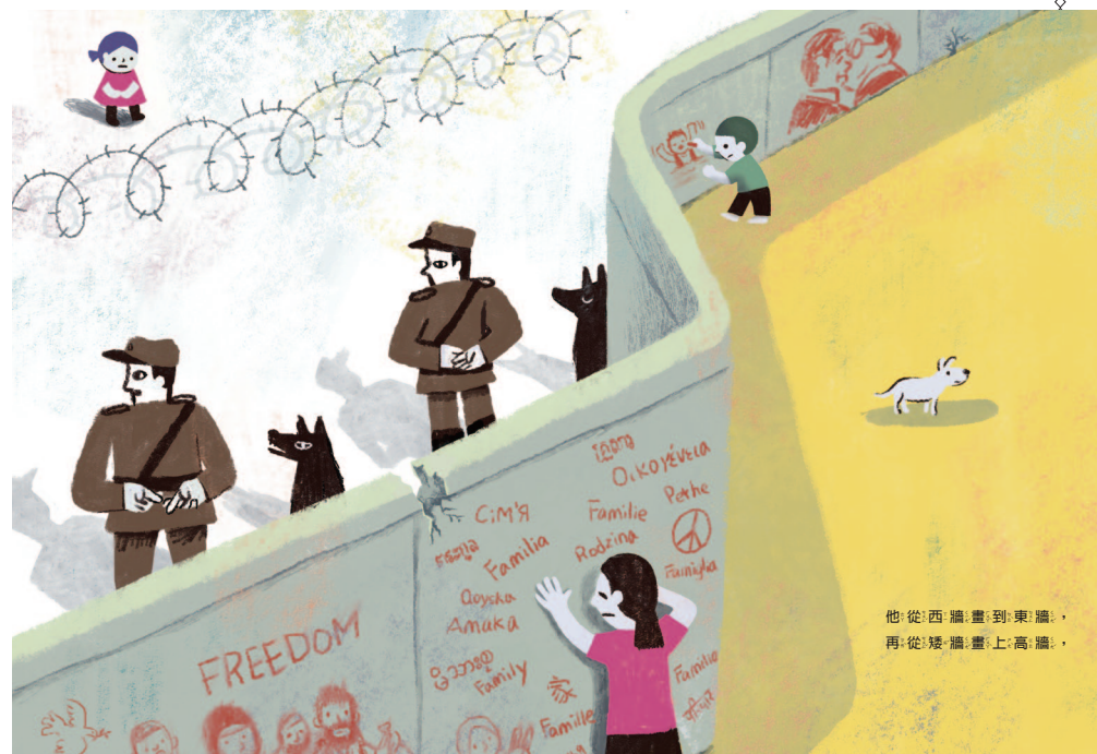
他從西牆畫到東牆，再從矮牆畫上高牆。